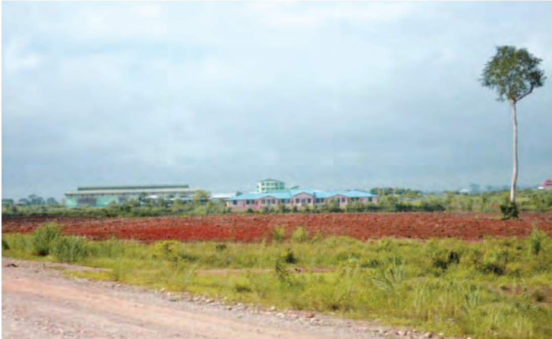
ကချင်ပြည်နယ် ဟူးကောင်းချိုင့်၎င်းဒေသရှိ ယုဇနကုမ္ပဏီစက်ရုံ

သူတို့ဆောက်ပေးတဲ့ အဆောက်အအုံ အိမ်ခြေတွေက နည်းပြီး အလုပ်သမားတွေက အင်မတန် များတယ်။ အများဆုံးက ရခိုင်တွေ။ နေရာမရှိတော့ အပြင်မှာ တဲမိုးလေးတွေနဲ့နေကြရတယ်။ အခန်းကျဉ်းလေးနဲ့ မိသားစု