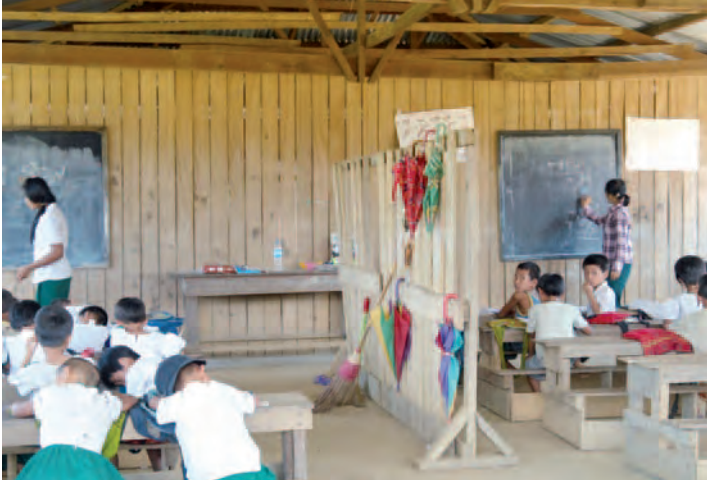
ဟူးကောင်းဒေသရှိ မူလတန်းကျောင်း

“ဒီမှာက ကျောင်းတော့ရှိပါတယ်။ ဒါပေမဲ့လည်း ကျွန်တော်တို့မှာ ပိုက်ဆံမရှိဘူး။ ကျောင်းက အခမဲ့ မဟုတ်တော့ ကျွန်တော်တို့ကလေးတွေကို ကျောင်းထားဖို့ မတတ်နိုင်ဘူး။” (အောင်မြင်သာစန်းမှ ဒေသခံ) “ယုဇနကုန်မ္မဂီက ဆောက်ထားပေးတဲ့ (တတိယတန်းထိသာရှိသည့်) မူလတန်းတစ်ကျောင်းပဲ ဒီစံပြု