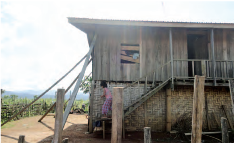
ဟူးကောင်းဒေသရှိ စံပြုအိမ်ယာများ

“ယုဇကုမ္ပဏီကလာပြီးတော့ ကျွန်တော်တို့အိမ်တွေကို စက်ကြီးတွေနဲ့ ဖျက်ဆီးပစ်တယ်။ စံပြုရွာကိုလည်း ကျွန်တော်တို့ကို အတင်းပြောင်းရွှေ့ခိုင်းတယ်။ ဒါပေမဲ့ ကျွန်တော်တို့မှာ အိမ်လည်းမရှိဘူး။ အဲဒီအချိန်တုန်းက လေကြီးမိုးကြီးကျတော့ ကျွန်တော်တို့ တော်တော်လေး အခက်အခဲကြုံရတယ်။ အဲဒါကြောင့် နေစရာရအောင် အိမ်အမြန်ဆောက်လိုက်ရတယ်။ ကျွန်တော်တို့ ရွာဟောင်းမှာနေတုန်းက အရမ်းကောင်းတဲ့အိမ်တွေ မပိုင်ပါဘူး။ ဒါပေမဲ့ အဲဒီအိမ်က လုံခြုံတယ်။ ခိုင်ခံ့မှုရှိတယ်။ အမိုးဆိုရင်လည်း ၄ နှစ်လောက်မှ တခါပဲ ပြောင်းရတယ်။ ဒီကအိမ်က အခုတောင် ပျက်စီးနေပြီ”