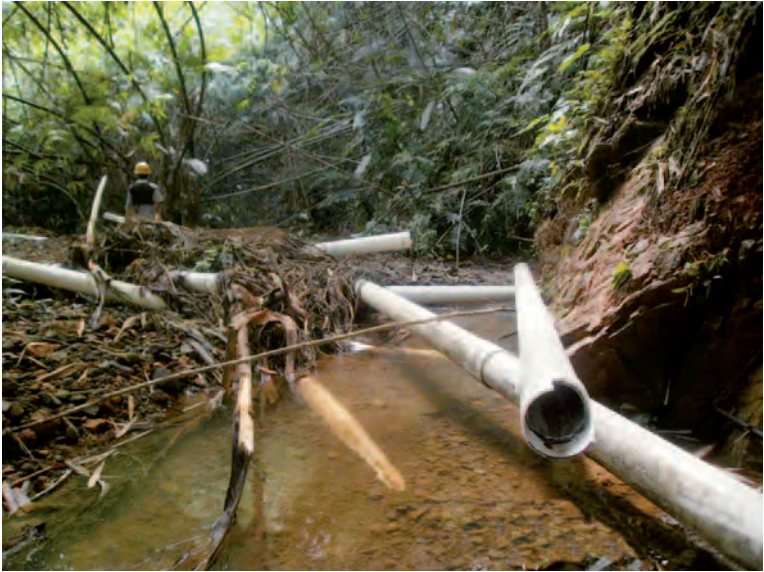
မလိယာန်ရွှေ့ပြောင်းစခန်းမှ ရေသွယ်ပိုက်များသည် ရောင်းရေလှုံ့၍ လွင့်စင်နေသည့်ပုံ။ ၁၉ရက် ၂၉ လပိုင်း၊ ၂၀၁၂ခုနှစ်။

“ကျွန်တော်တို့ ဒီမှာနေရတာ မပျော်ဘူး။ မိုးရာသီဆိုရင် ရေတွင်းတွေလည်း ရွံ့တွေနဲ့ပဲပြည့်နေတော့ သောက်ရေအတွက် အရမ်းအခက်အခဲကြုံရတယ်။ အစိုးရနဲ့ကုမ္ပဏီက ကျွန်တော်တို့ကို ဘာမှ ထောက်ပံ့ပေးတာ မရှိတော့ဘူး။” (စံပြု ဒေသခံ)