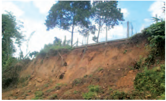
မလိယာန်ရှိ (CPI) ဆောက်လုပ်ပေးထားသော လမ်းမြင်ကွင်းတနေရာ။