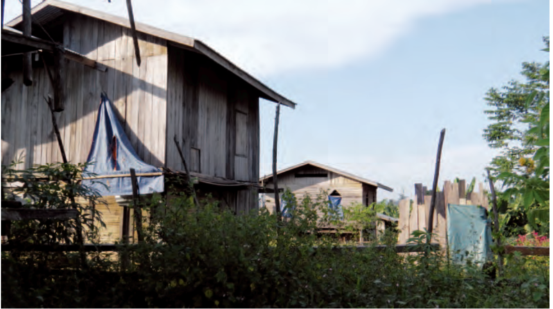
ဟူးကောင်းဒေသရှိ စံပြုအိမ်ယာများ

“ယုဇကုမ္ပဏီကလာပြီးတော့ ကျွန်တော်တို့အိမ်တွေကို စက်ကြီးတွေနဲ့ ဖျက်ဆီးပစ်တယ်။ စံပြုရွာကိုလည်း ကျွန်တော်တို့ကို အတင်းပြောင်းရွှေ့ခိုင်းတယ်။ ဒါပေမဲ့ ကျွန်တော်တို့မှာ အိမ်လည်းမရှိဘူး။ အဲဒီအချိန်တုန်းက လေကြီးမိုးကြီးကျတော့ ကျွန်တော်တို့ တော်တော်လေး အခက်အခဲကြုံရတယ်။ အဲဒါကြောင့် နေစရာရအောင် အိမ်အမြန်ဆောက်လိုက်ရတယ်။ ကျွန်တော်တို့ ရွာဟောင်းမှာနေတုန်းက အရမ်းကောင်းတဲ့အိမ်တွေ မပိုင်ပါဘူး။ ဒါပေမဲ့ အဲဒီအိမ်က လုံခြုံတယ်။ ခိုင်ခံ့မှုရှိတယ်။ အမိုးဆိုရင်လည်း ၄ နှစ်လောက်မှ တခါပဲ ပြောင်းရတယ်။ ဒီကအိမ်က အခုတောင် ပျက်စီးနေပြီ”