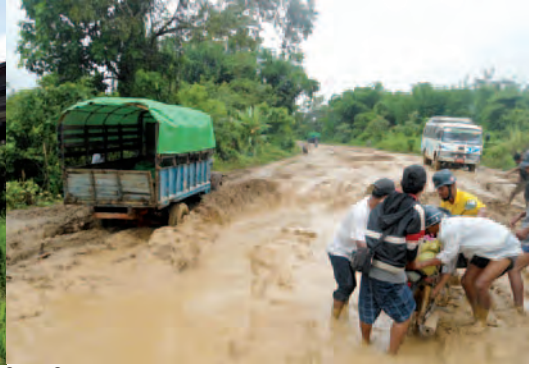
ဟူးကောင်းဒေသ ရှိ လမ်းတနေရာ

“လမ်းတွေက မိုးရာသီဆိုရင် အရမ်းဆိုးတယ်။ ရွံ့တွေအရမ်းထူလို့ လမ်းတောင်မလျှောက်နိုင်ဘူး။ သယ်ယူပို့ဆောင်ရေးအတွက် လမ်းတွေက သွားလို့တောင်မရတော့တဲ့ အခြေအနေမှာရှိပေမယ့် ကုမ္ပဏီက နေပြီးတော့ ကျွန်တော်တို့အတွက် ဘာမှမလုပ်ပေးဘူး။”