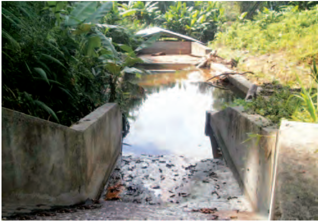
မလိယာန်ရွှေ့ပြောင်းစခန်းရှိ CPI ကဆောက်လုပ်ပေးထားသော ရေလှောင်ကန်

“လူဦးရေ တစ်ထောင်အတွက် ကောင်းကောင်းခပ်သောက်လို့ရတဲ့ ရေတွင်းက ၃၂ တွင်းလောက်ပဲ ရှိတယ်။ ရွာသားတွေရဲ့ ကျွဲ၊ နွားတွေက ခဏခဏ ရေတွင်းထဲသို့ ပြုတ်ကျသေတယ်”